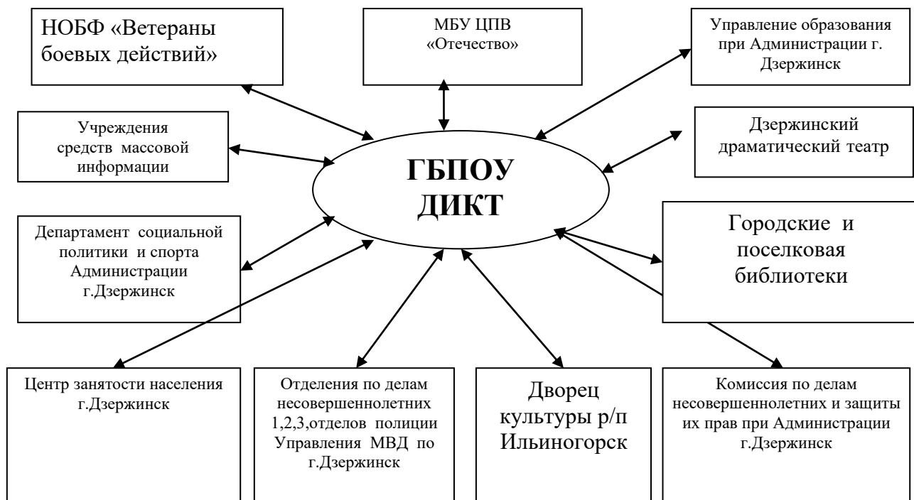
Рис. 2. Структура взаимодействия модели воспитательного процесса ГБОУ ДИКТ с внешними организациями г. Дзержинск