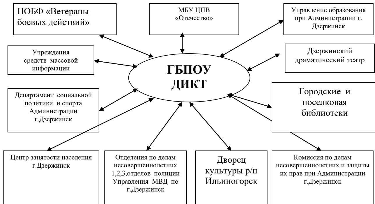
Рис. 2. Структура взаимодействия модели воспитательного процесса ГБОУ ДИКТ с внешними организациями г. Дзержинск